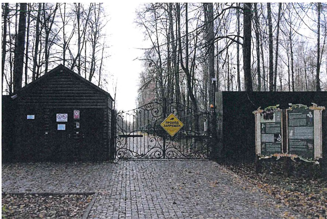
2) Входная группа в Центральный зубровый питомник