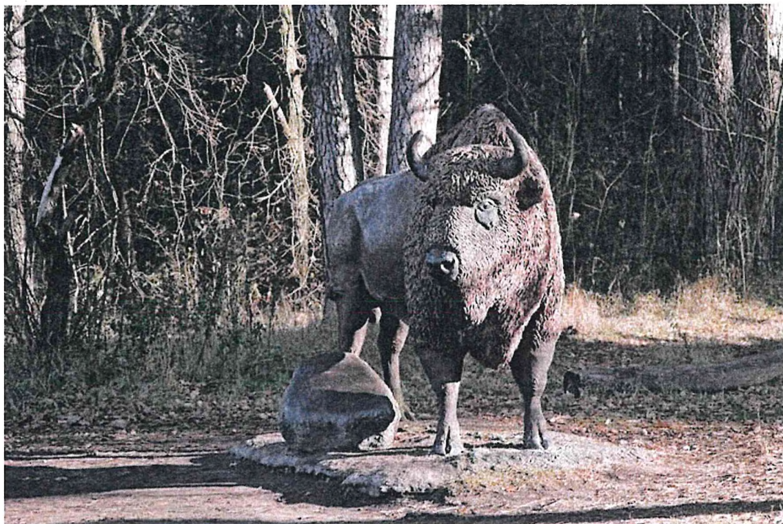
1) Скульптура «Зубр»