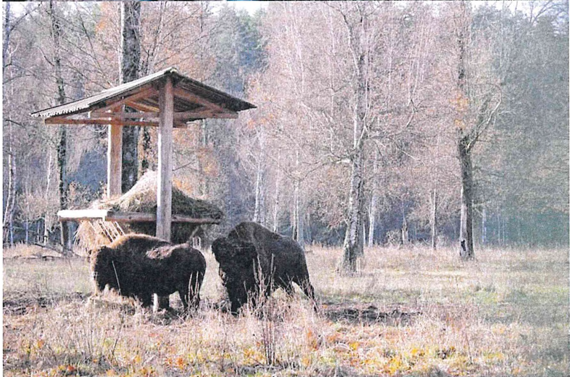
4) Загоны, предназначенные для содержания и разведения зубров № 5, № 4, и бизонов № 2