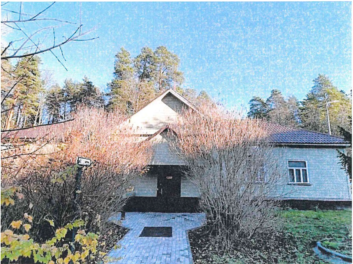
6) Музей природы