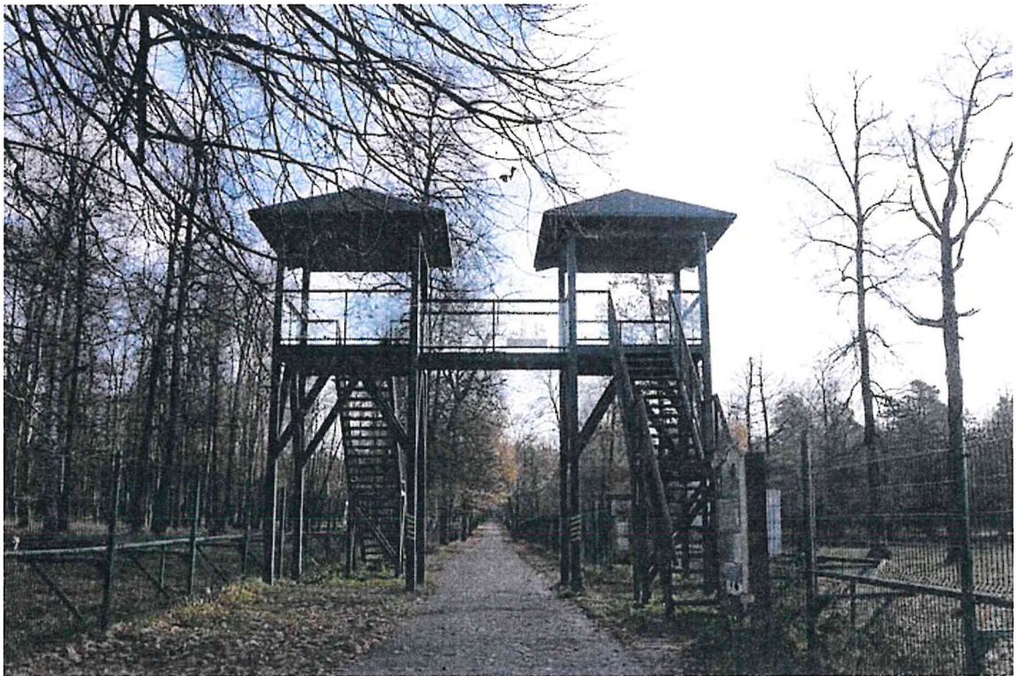
5) «Смотровая площадка»